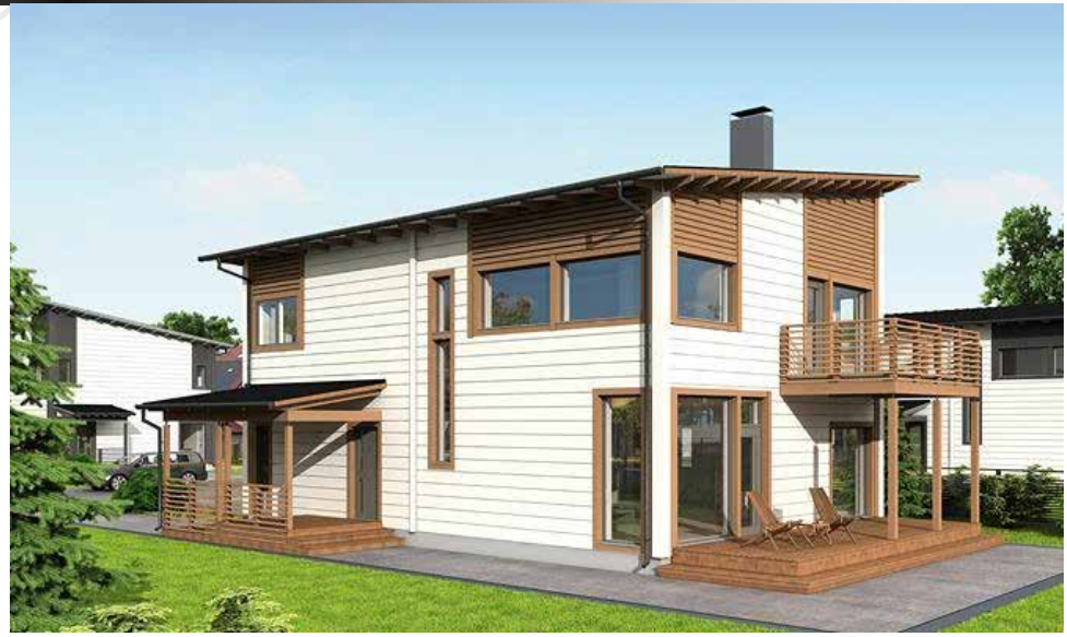
Mallinnos ampumahiihtäjä Kaisa Mäkäräisen talosta